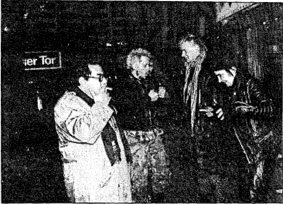
مؤلف الكتاب في حوار مع مجموعة من أعضاء جماعة عبادة الشيطان في مدينة برلين الألمانية